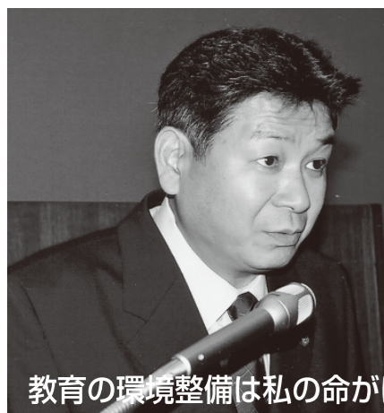
教育の環境整備は私の命がけのテーマです