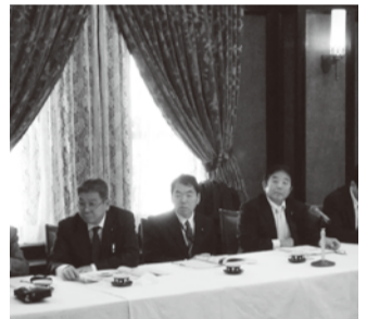
●エネルギー雇用促進調査特別委員会県外調査(都内学生会館)