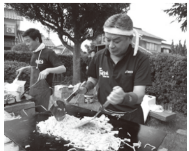
北四丁目町内納涼祭で毎年焼きそば担当