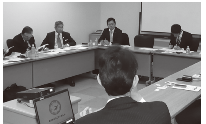
●企画県土警察常任委員会県外調査 地域資源の活用について(JR九州)