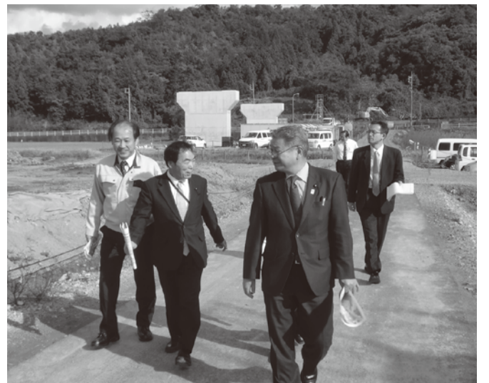
●決算審査特別委員会現地調査(鳥取西道路について)