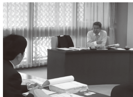
●企画県土警察常任委員会県外調査 ツーリズム戦略について(大分県庁)