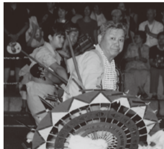
●しゃんしゃん祭り子ども達400人と踊る