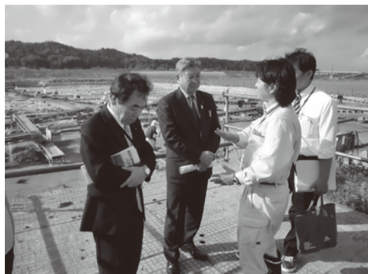
決算審査特別委員会現地調査（鳥取西道路にかかる埋蔵文化財発掘調査の状況について）