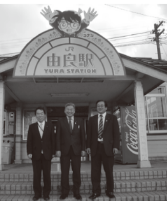
決算審査特別委員会現地調査