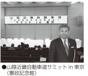
●山陰近畿自動車道サミット in 東京(憲政記念館)