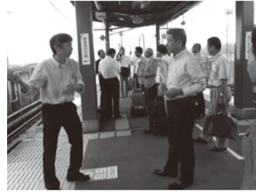
●地域振興県土警察常任委員会県外調査(北越急行の取り組み)