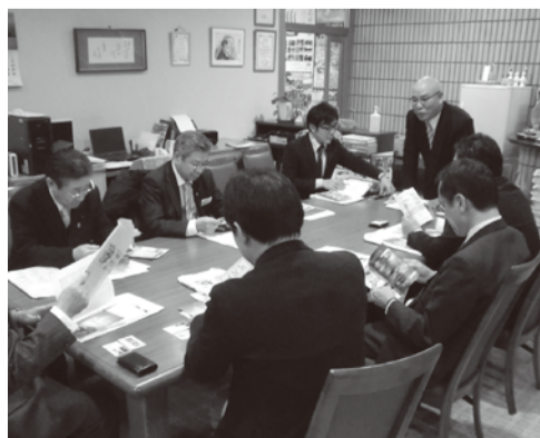
企画県土警察常任委員会現地調査（別府市観光協会）