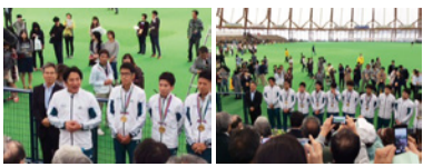
2015.10.12 出雲駅伝応援 母校青山学院大学優勝(出雲市)

全国各地でブランド化され、かつて鳥取茸王の名で売り出した発祥の地・鳥取県でも「復活」を目指していた。