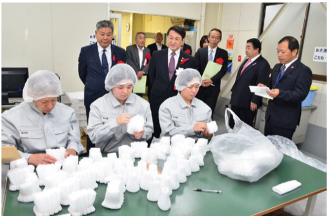
果物の防護ネットを束ねる作業に励む利用者ら=1日、鳥取市商栄町の「ワークコーポとっとり」