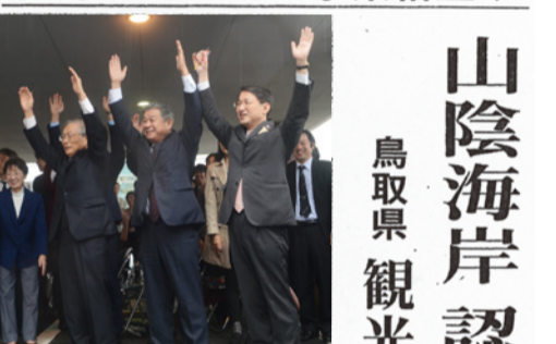
記念式典で万歳をして、世界ジオパークのユネスコ正式事業への格上げを喜ぶ平井伸治知事(右)ら関係者=鳥取市東町1丁目、県庁

世界ジオパークのユネスコ正式事業への格上げを喜ぶ平井伸治知事(右)ら関係者=鳥取市東町1丁目、県庁