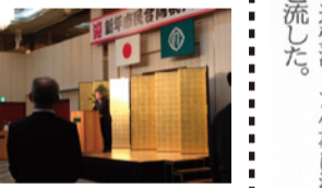
2016.1.4 鳥取市新年祝賀会挨拶