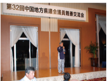
2015.9.6 第32回中国地方県議会議員親睦交流会で優勝(広島市)