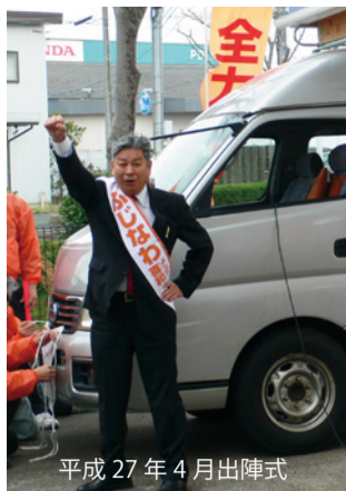
平成 27 年 4 月 出陣式