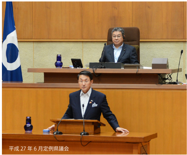
平成 27 年 6 月 定例県議会