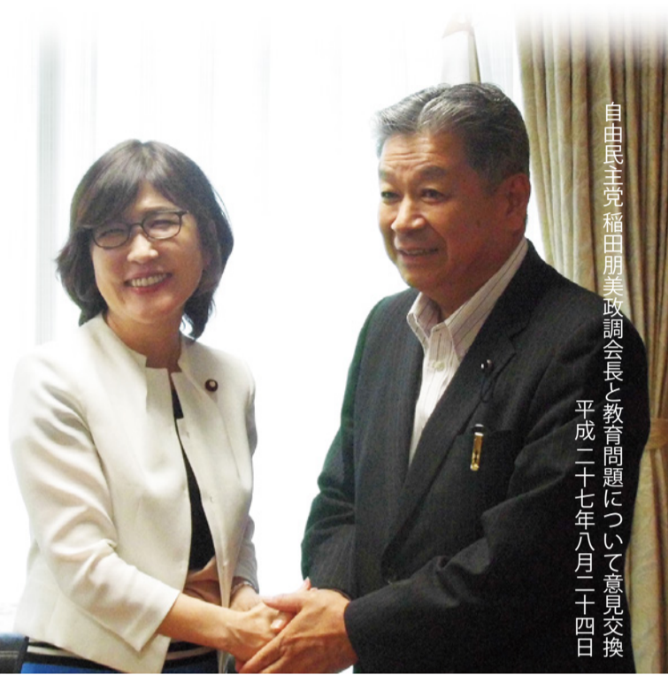
自由民主党 稲田朋美政調会長と教育問題について意見交換 平成二十七年八月二十四日