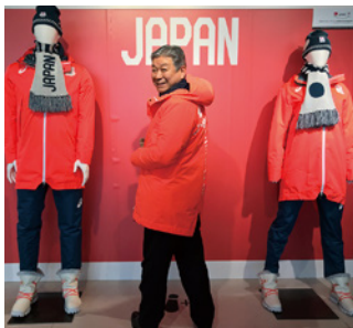
アシックススポーツミュージアム