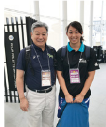
2017.9.16 オリンピックメダリスト 女子平泳ぎ 鈴木聡美選手 と(松山市/愛媛国体)