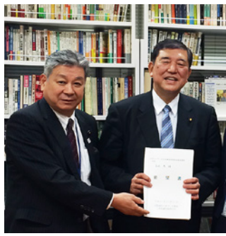
石破代議士に要望活動