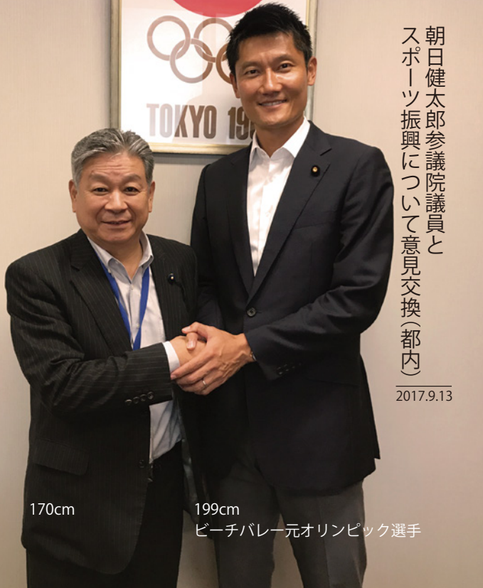
朝日健太郎参議院議員と スポーツ振興について意見交換(都内)