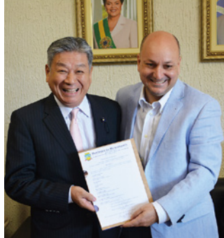
ブラジルミランドポリス市長を表敬