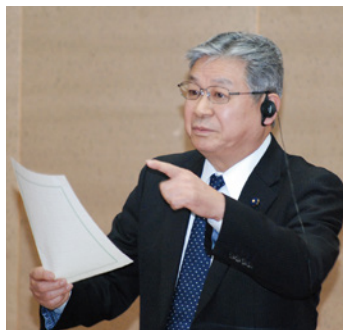
平成30年3月13日一般質問